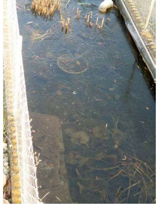
Oben Alles Bilder vom 14.01.2012